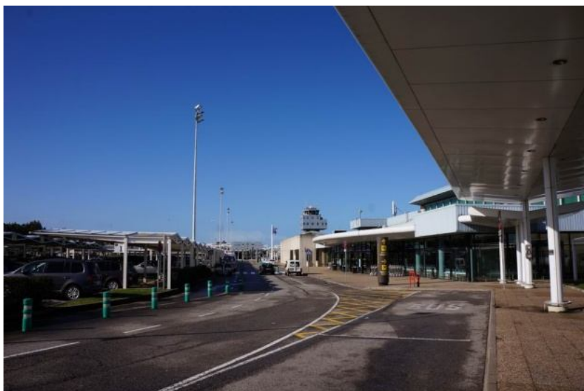
Аэропорт Астурии. Остановка аэроэкспресса для выгрузки пассажиров.

Астурийский амбар. Еще одна визитная карточка княжества. Показалось забавным, что при поиске информации об Астурии, мне попалась в интернете статья, написанная на материале диссертации по Астурийским амбарам! Более того, удивительно, но диссертация эта была написана на русском языке! Из статьи я неожиданно для себя теперь знаю, что хлебные амбары в Астурии бывают двух типов — «hórreo» и «cranega», но вот отличить один от другого точно не смогу.