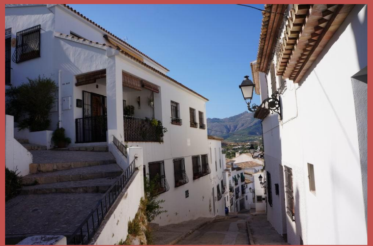
На улицах Альтеи.

Самым интересным нам показался квартал Bellaguarda, основанный в XIV веке - тоже, разумеется, реконструированный, но все-таки сохранивший какую-то индивидуальность. Наверное, он оказался единственным в городе, что нам безоговорочно понравился.